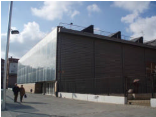
Biblioteca de Mataró, amb panells solars a la façana

L'Ajuntament de Mataró, a través de la seva Oficina Agenda 21, ha iniciat el projecte Mataró Educació i Sostenibilitat – MES. L'objectiu específic és elaborar una estratègia d'educació per a la sostenibilitat amb objectius, actuacions definides i mecanismes d'avaluació que respongui a la realitat del municipi i a les previsions de futur. Es vol que aquesta estratègia dirigeixi la política municipal en matèria d'educació per a la sostenibilitat en els propers anys.