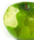
CRISI DE CREIXEMENT: ENS CAL DECREIXEMENT?